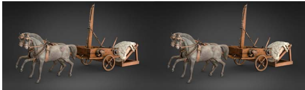
Maquette de catapulte, Musée d'archéologie nationale (Saint-Germain-en-Laye)