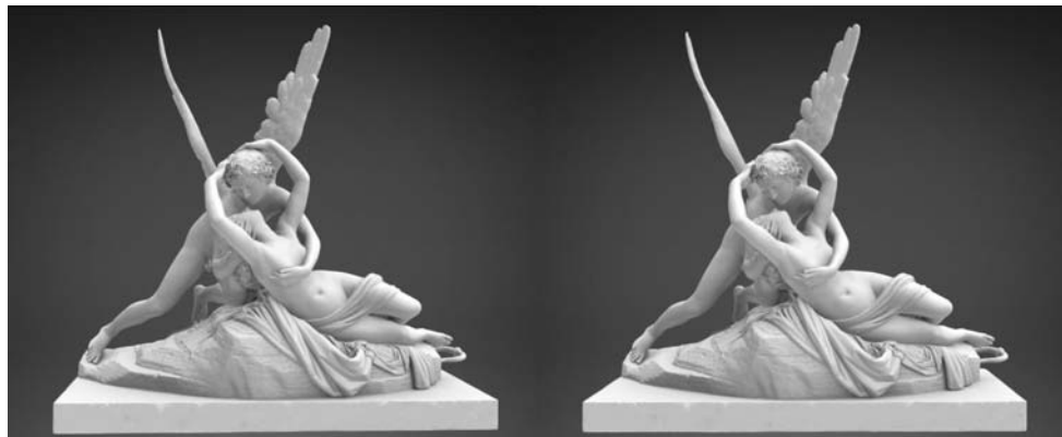
Psyché ranimée par le baiser de l'Amour - modèle 3D