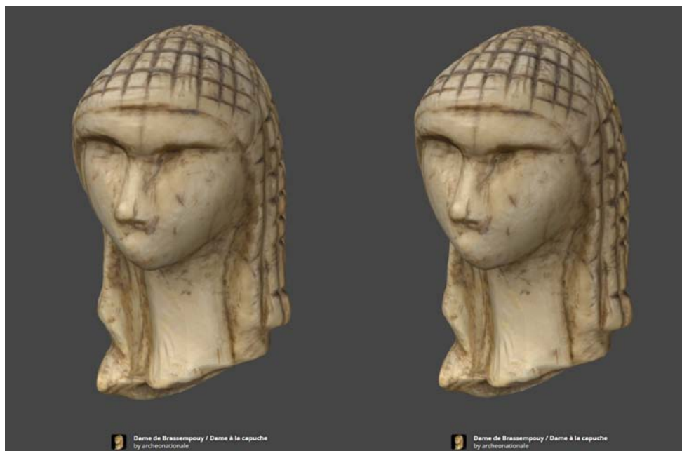
Dame de Brassempouy à la capuche, Musée d'archéologie nationale (Saint-Germain-en-Laye)